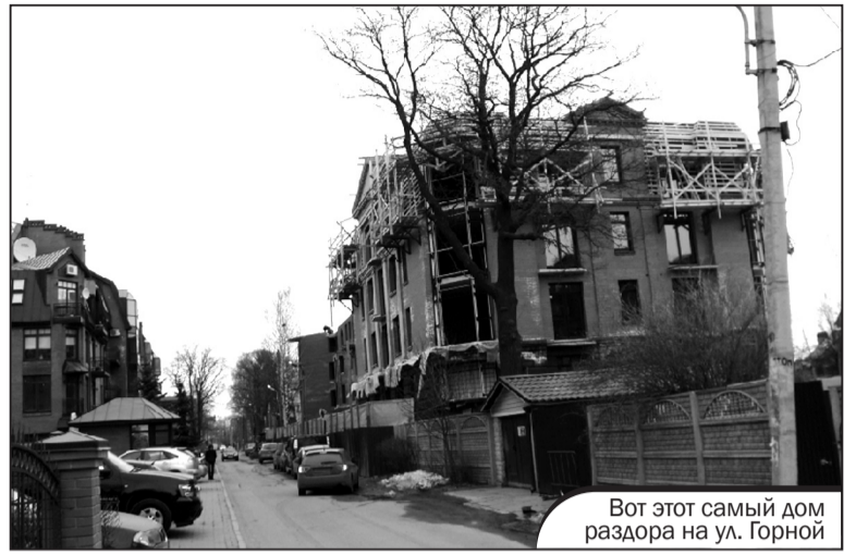
Вот этот самый дом раздора на ул. Горной

5. Строящийся многоквартирный дом практически полностью занимает земельный участок: не оставлено места для