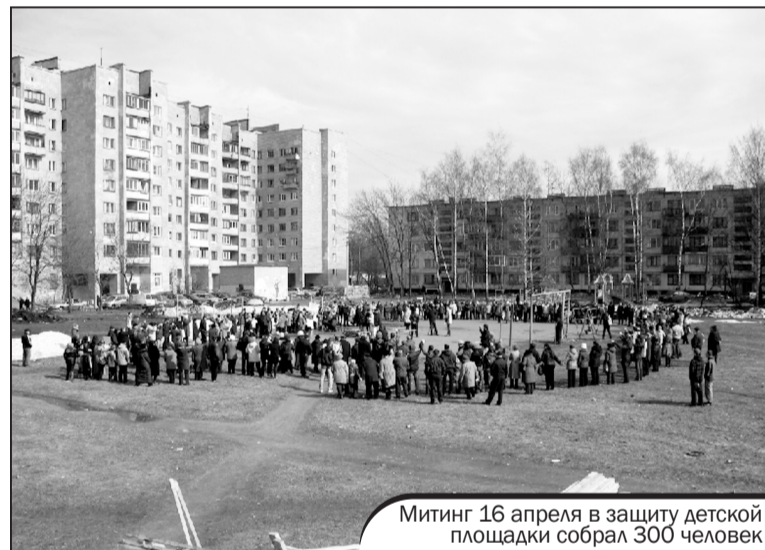
Митинг 16 апреля в защиту детской площадки собрал 300 человек

Неоднократно критикуя градостроительную политику, проводящуюся в Санкт-Петербурге, депутат Малков С. А. всегда основной упор делал на социальные проблемы, которые порождаются чрезмерным вниманием к интересам инвесторов в ущерб гражданам. Анализ, проведенный в рамках только одного Калининского района, показал, что десятки территорий, предназначенных под строительство объектов для обслуживания населения, были отданы под коммерческую застройку. Таким образом, ухудшение условий жизни горожан превратилось в прямой ресурс для извлечения прибыли строительным бизнесом. Власть, отдав самые лакомые куски под коммерческую застройку, теперь в попытке решить социальные